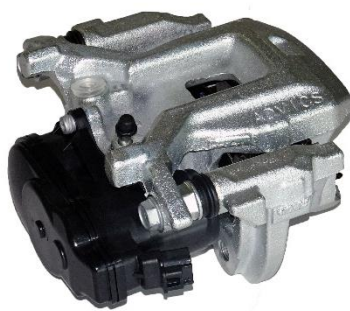
キャリパー体式電動パーキングブレーキ

アドヴィックスは 2006 年に電動パーキングブレーキの生産を開始し、2014 年には世界初のドラム一体式電動パーキングブレーキを開発するなど、ラインアップの拡充を進めており、軽自動車から大型 SUV まで幅広い領域をカバーしています。